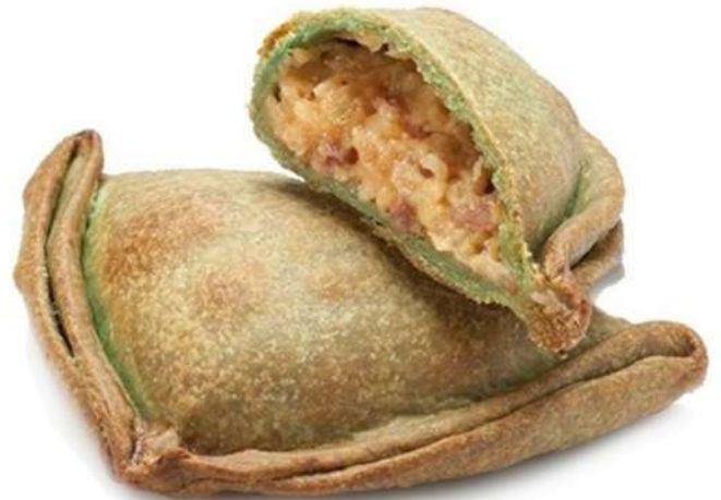
Empanadilla Cebolla caramelizada, Queso de Cabra y Jamón Caja 36 Unidades. 125 gr. Aprox.