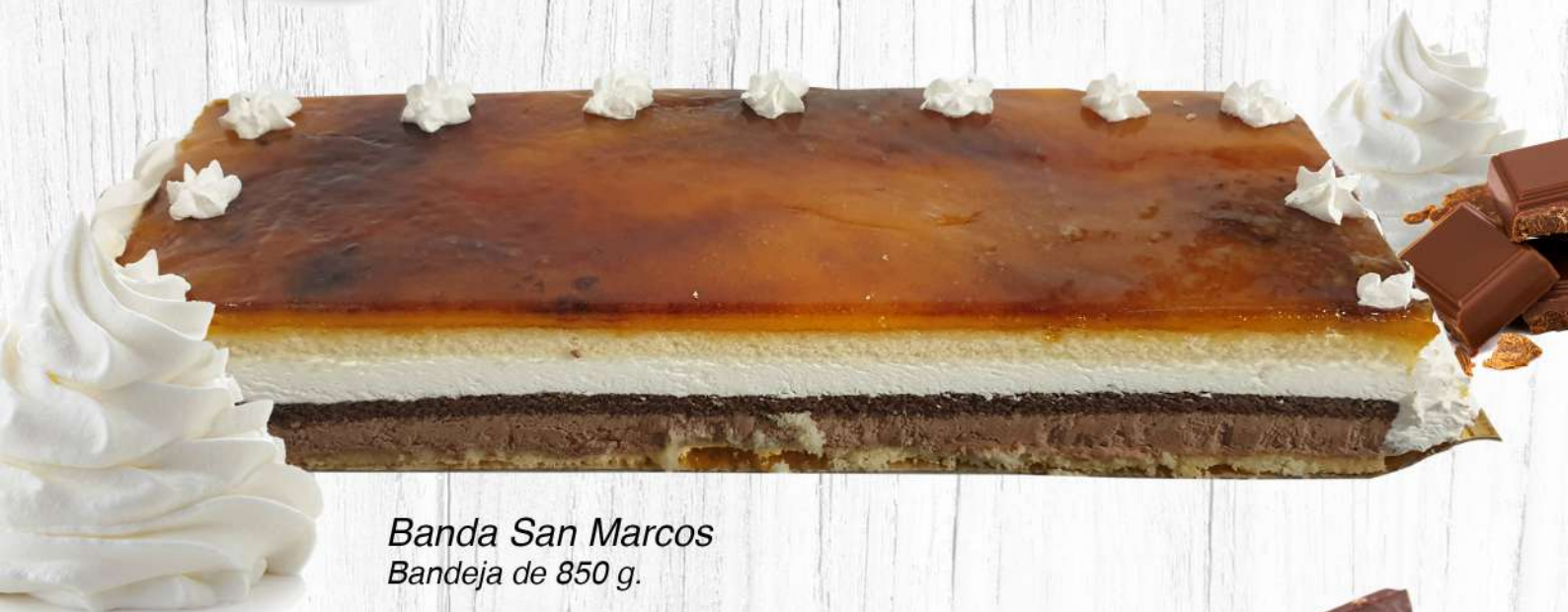
Banda San Marcos Bandeja de 850 g.