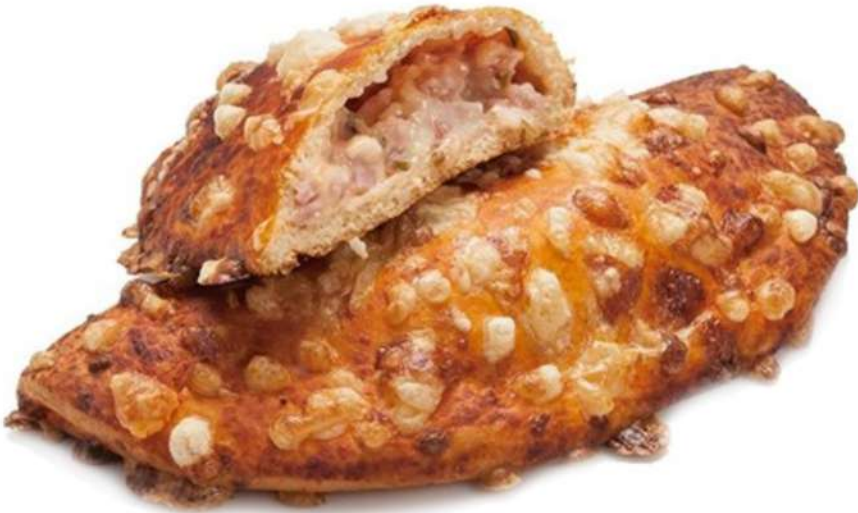
Pizza Calzone Mixta Caja 48 Unidades. 165 gr. Aprox.