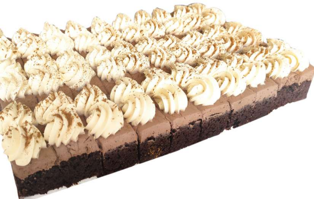
Plancha decorada Brownie y trufa 30 porciones