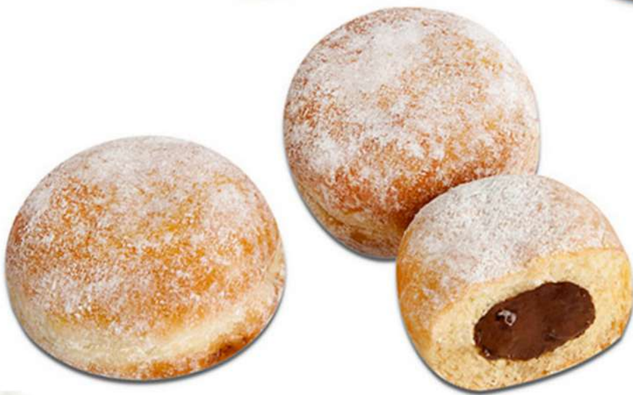
Mini Berlina Choco Caja 70 Unidades. 25 gr. Aprox.