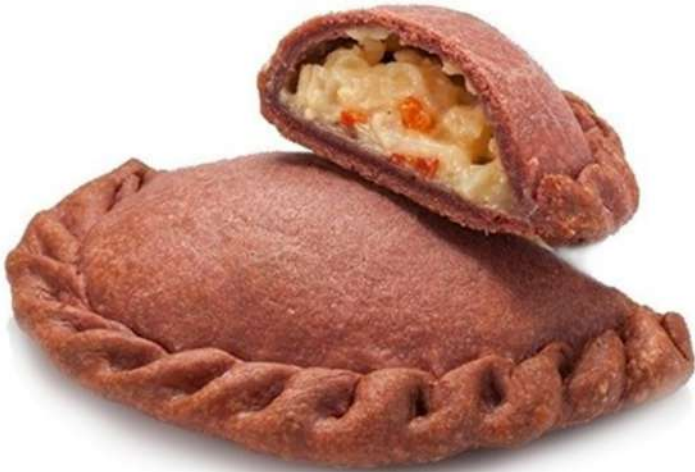
Empanadilla Mexicana Roja Caja 36 Unidades. 125 gr. Aprox.