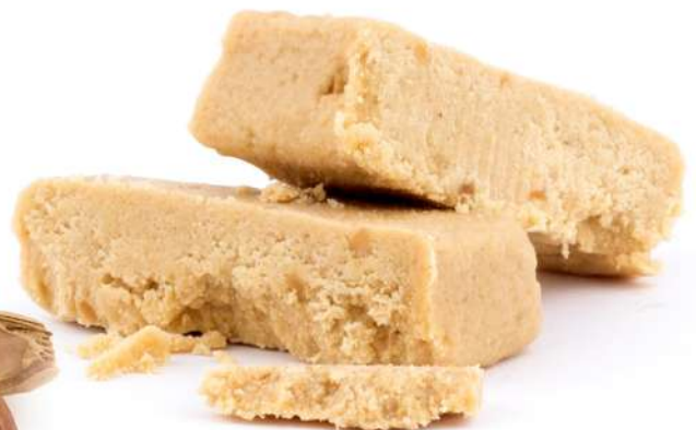
Turrón de Jijona en Crema Cubo de 1 kg.