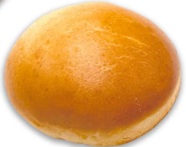
Brioche Hamburguesa Cortada Caja 45 Unidades. 80 gr. Aprox.