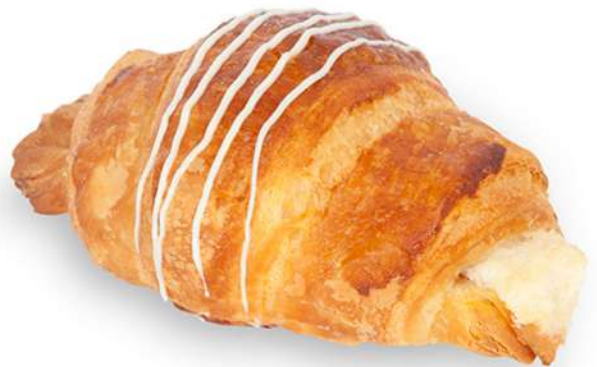
Croissant de Choco Blanco Rapid Fermentado Caja 105 Unidades. 55 gr. Aprox.