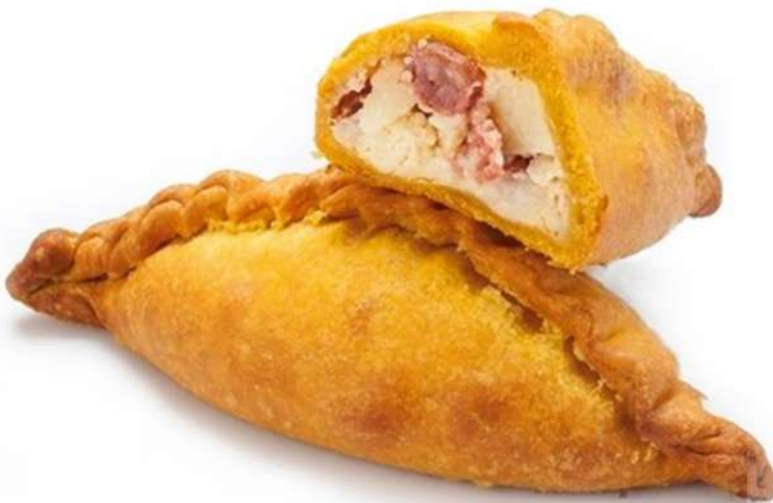
Empanadilla Tortilla con Ali-oli y chistorra Caja 36 Unidades. 125 gr. Aprox.