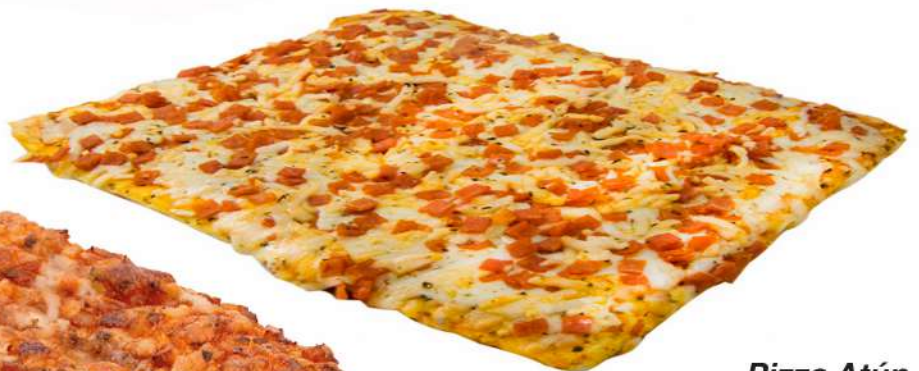
Pizza Atún 20 Porciones Caja