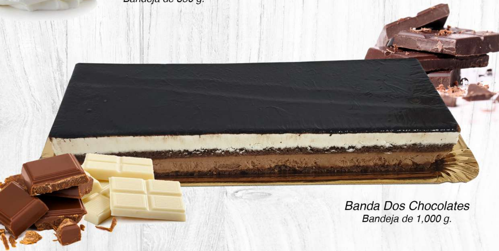
Banda Dos Chocolates Bandeja de 1,000 g.