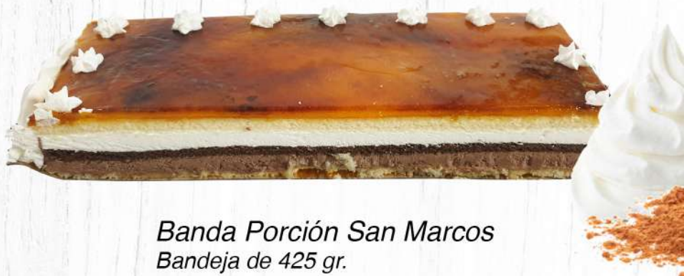
Banda Porción San Marcos Bandeja de 425 gr.