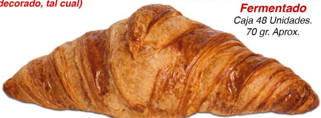
Croissant Parisino 100% Mantequilla Fermentado Caja 48 Unidades. 70 gr. Aprox.