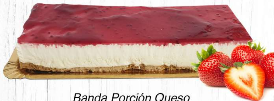
Banda Porción Queso Bandeja de 500 gr.