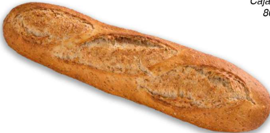
BAGUETINA INTEGRAL Caja 60 Unidades. 110 gr. Aprox. (CON SALVADO)