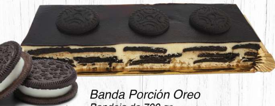
Banda Porción Oreo Bandeja de 700 gr.