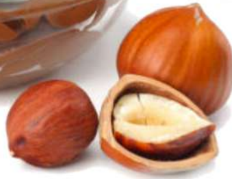
Cubo Crema Cacao 3 Kg.