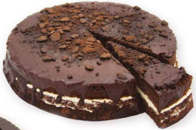
Tarta Galleta Cacao 750 gr.