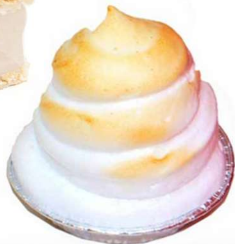
Souffles Caja de 12 Unidades