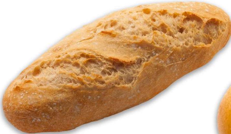
Barrita 140 gr. Express Caja 55 Unidades.