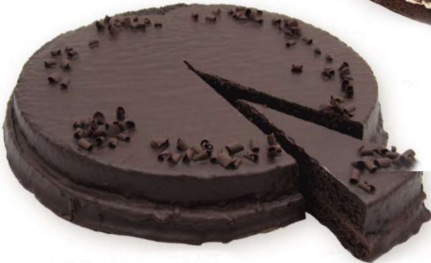
Tarta Muerte por chocolate 750 gr.