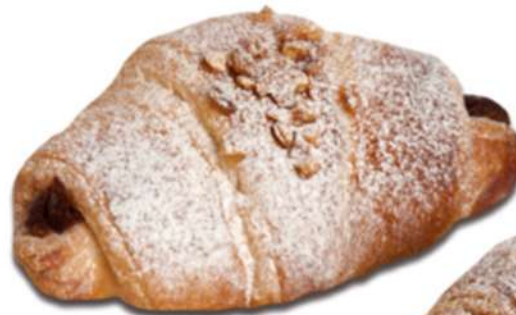
Croissant Petit Bombón PARA FERMENTAR Caja 166 Unidades. 30 gr. Aprox.