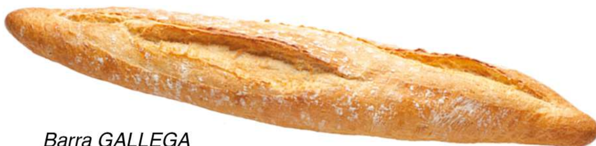
Barra GALLEGA ARTESANA Caja 20 Unidades. 270 gr. Aprox.