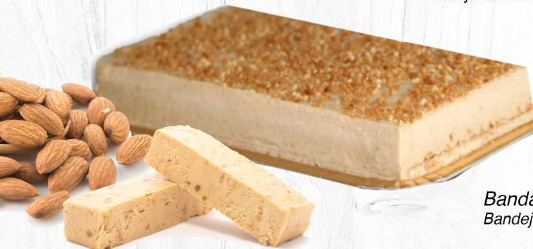
Banda Porción Turrón Jijona Bandeja de 500 gr.