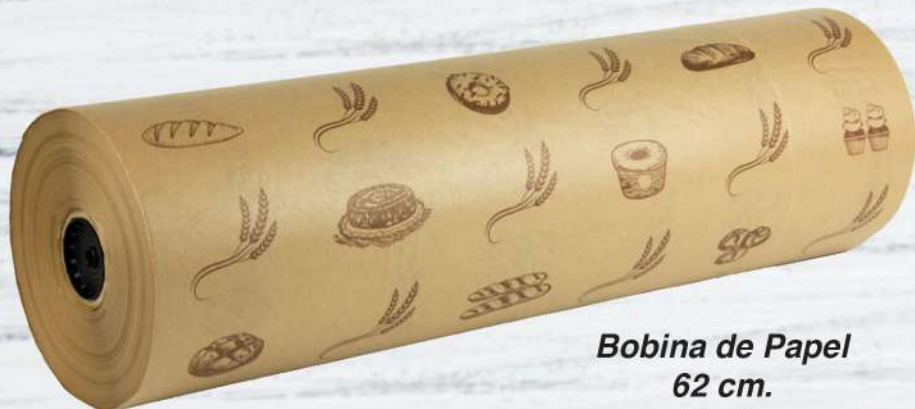
Bobina de Papel 62 cm. 10 Kg.