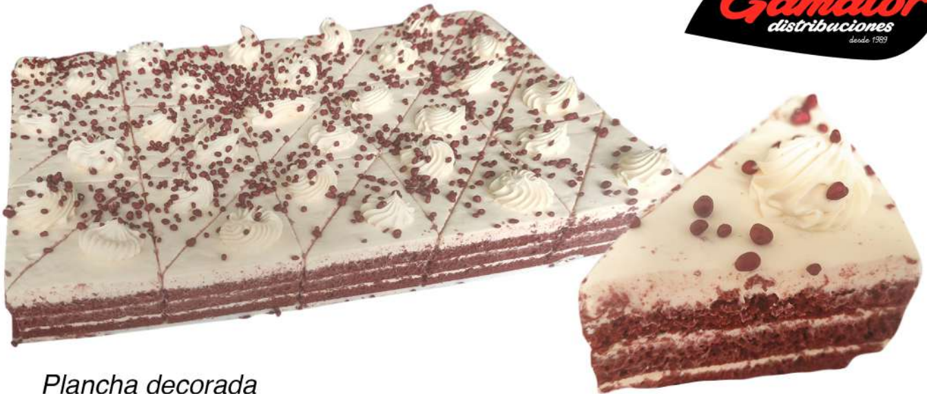
Plancha decorada Red Velvet 30 porciones