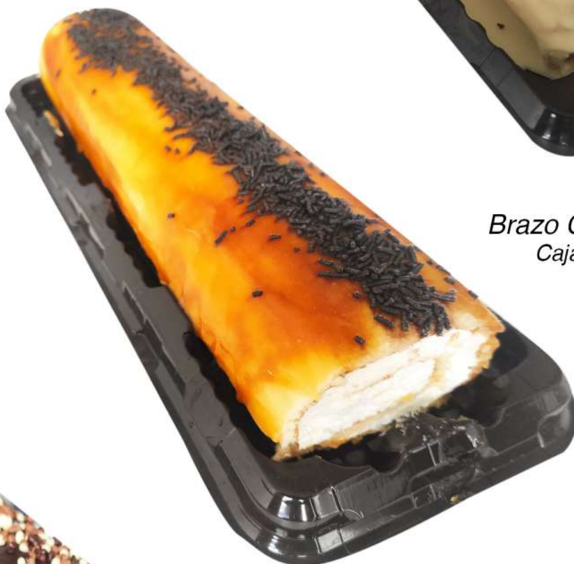
Brazo Yema Caja de 3 Unidades