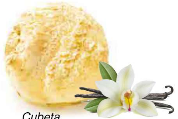
Cubeta 2500 MI.