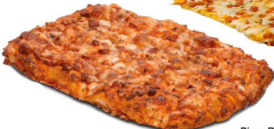
Pizza York y queso 20 Porciones Caja