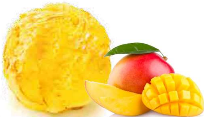
Cubeta 2500 MI.