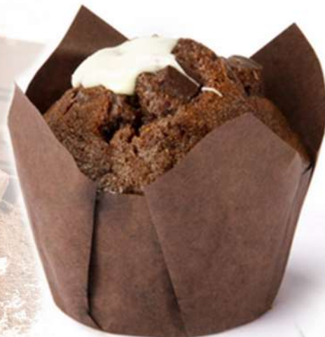
Tulipa Passión Chocolate Medium Caja 20 Unidades. 60 gr. Aprox.