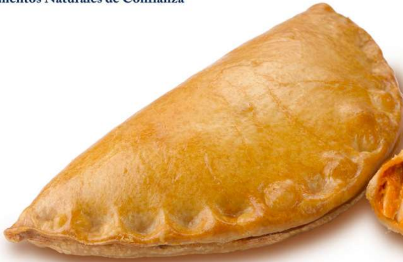
Empanadilla Tomate 135 gr - 24 Uni Caja