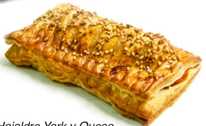
Hojaldre York y Queso Caja 24 Unidades. 140 gr. Aprox.