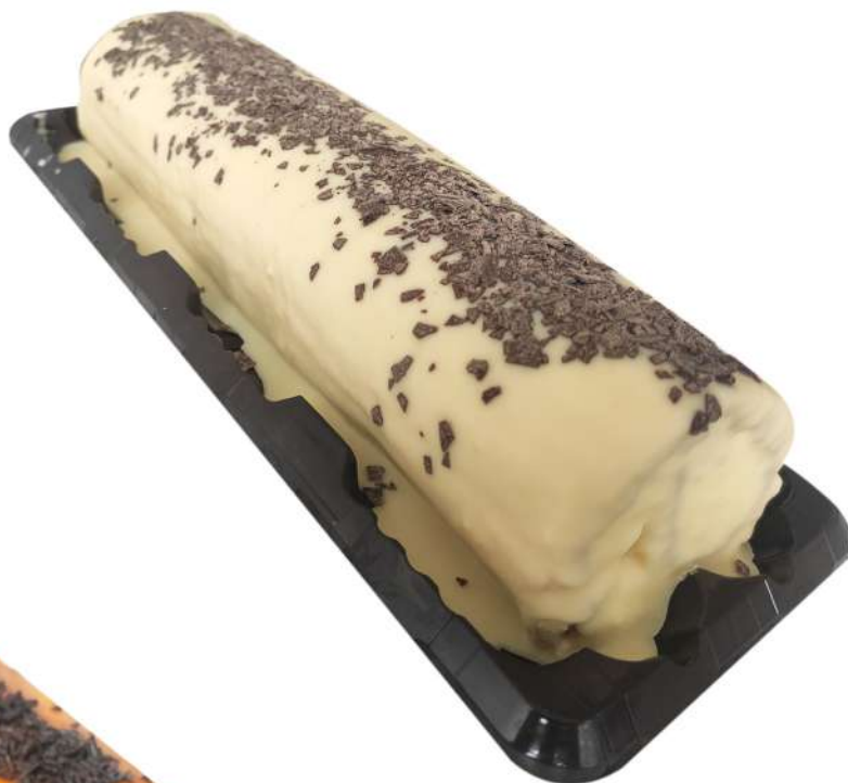
Brazo Chocolate Blanco Caja de 3 Unidades