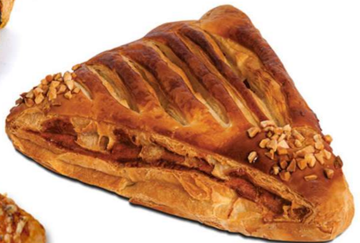
Triangulo de Atún Caja 45 Unidades. 145 gr. Aprox.