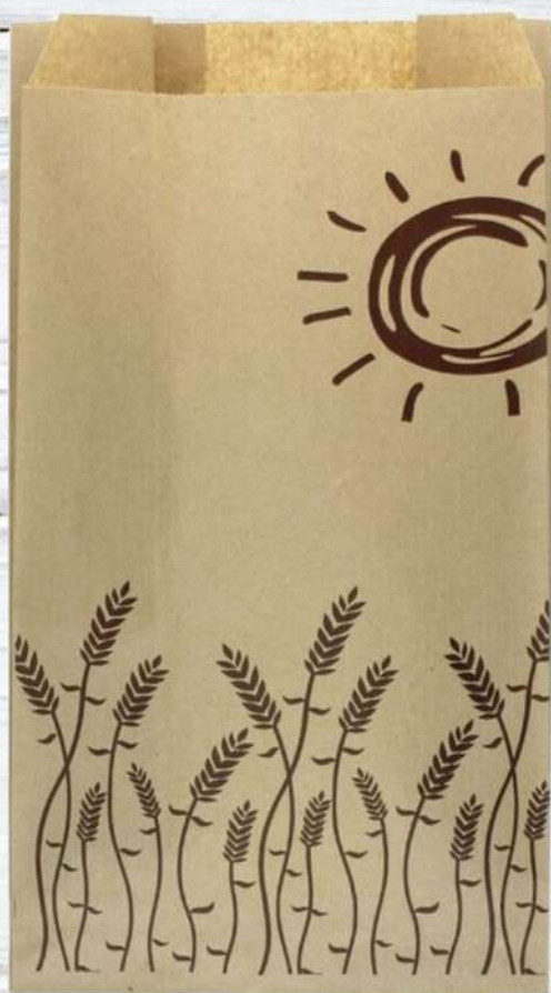
Bolsa de Pan 4 Barras 18x6x51 cm. Caja de 1000 Unidades