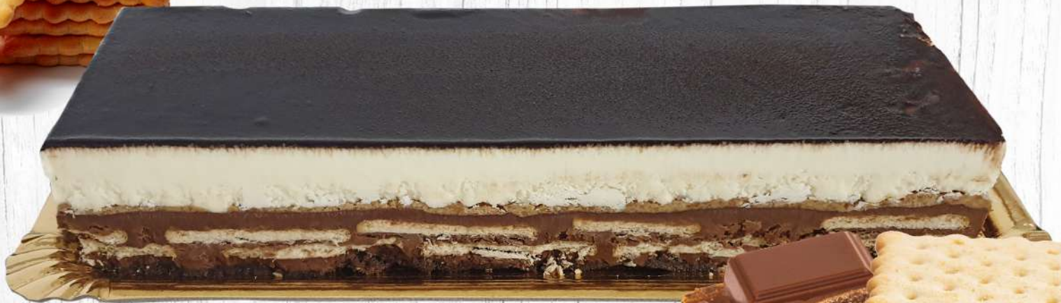
Banda Galleta Tio Paco Bandeja de 1,300 g.