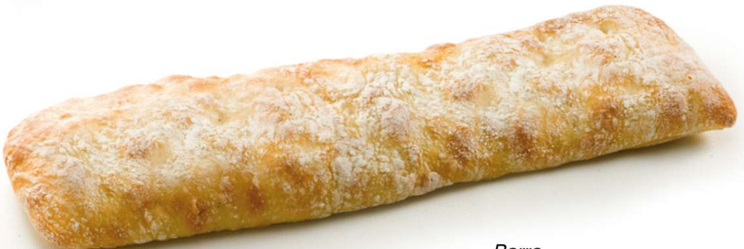
Barra RÚSTICA CRISTAL Express Caja 14 Unidades. 240 gr. Aprox.