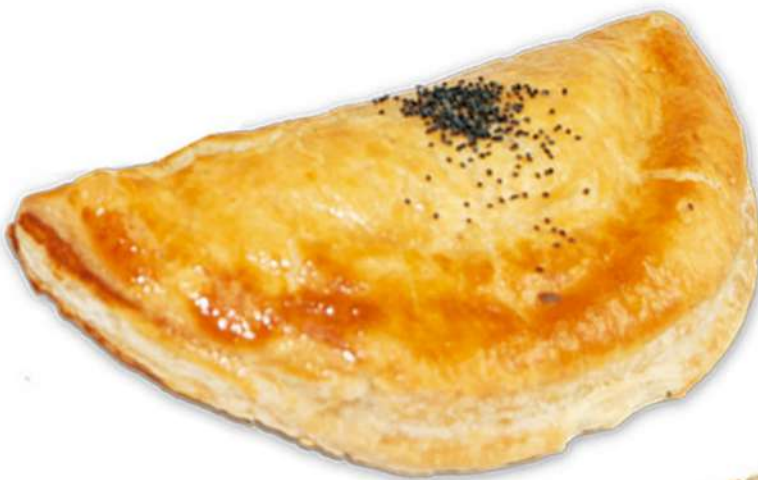
Empanadilla Hojaldre Caja 24 Unidades. 140 gr. Aprox.