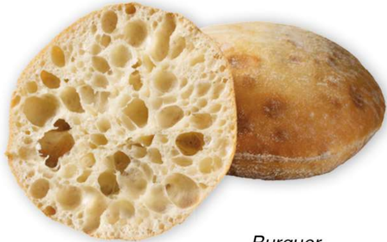
Burger RÚSTICA CRISTAL Express Caja 66 Unidades. 110 gr. Aprox.