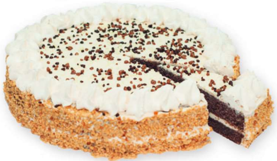
Tarta Kinder 750 gr.