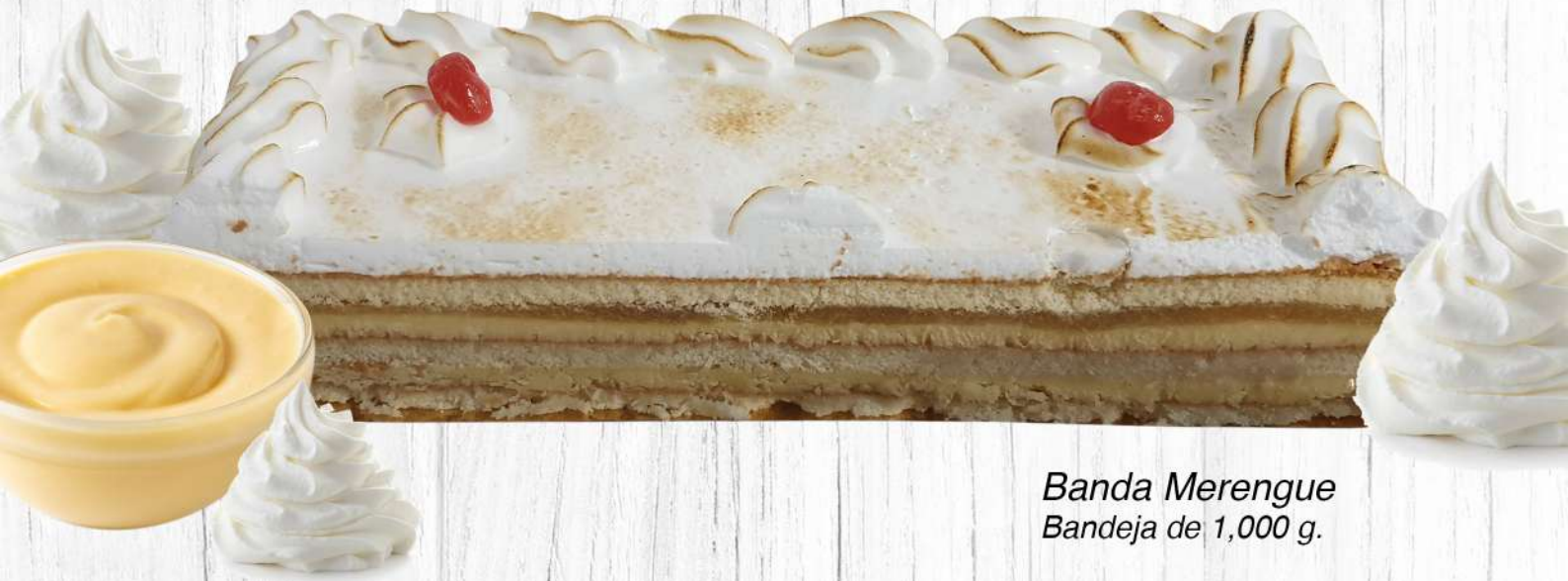
Banda Merengue Bandeja de 1,000 g.