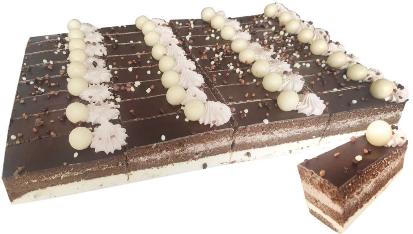
Plancha decorada 3 chocolates 32 porciones