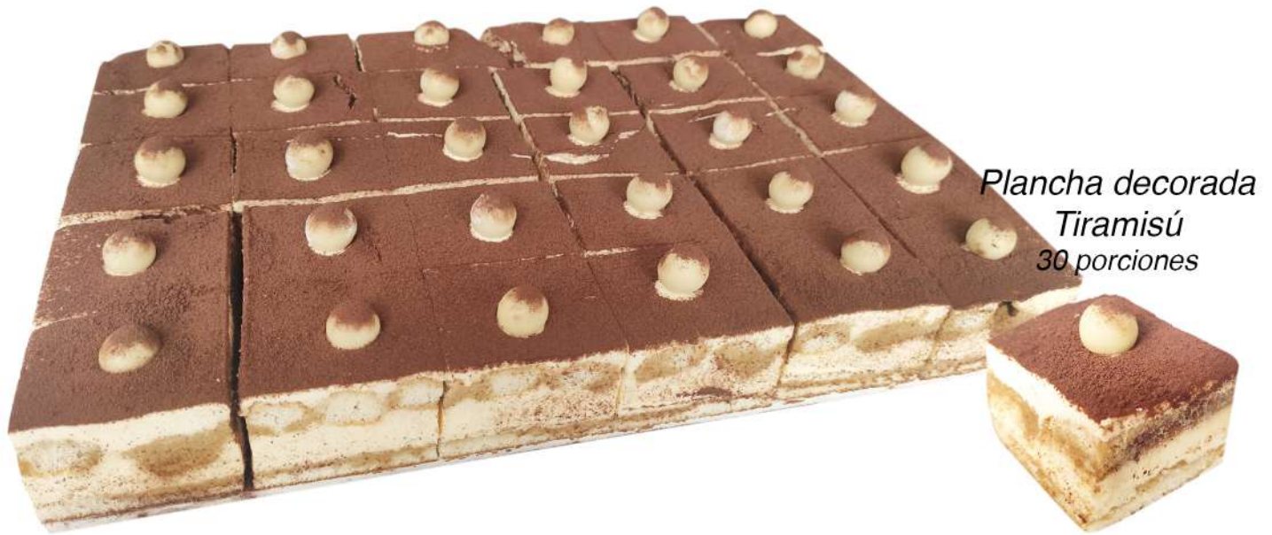
Plancha decorada Tiramisú 30 porciones