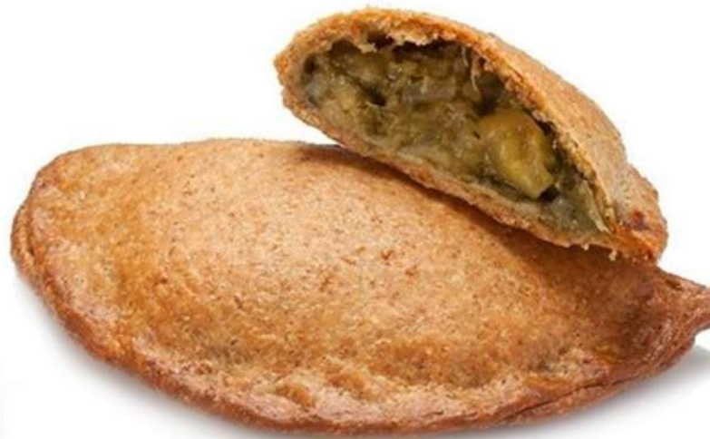
Empanadilla Integral Vegana Caja 45 Unidades. 125 gr. Aprox.