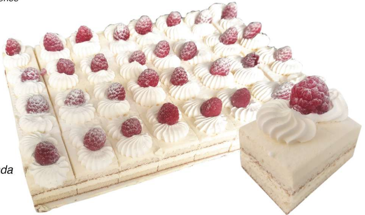
Plancha decorada Maracuyá 32 porciones