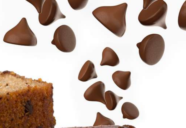
Torta Casera Choco Chips 2000 gr