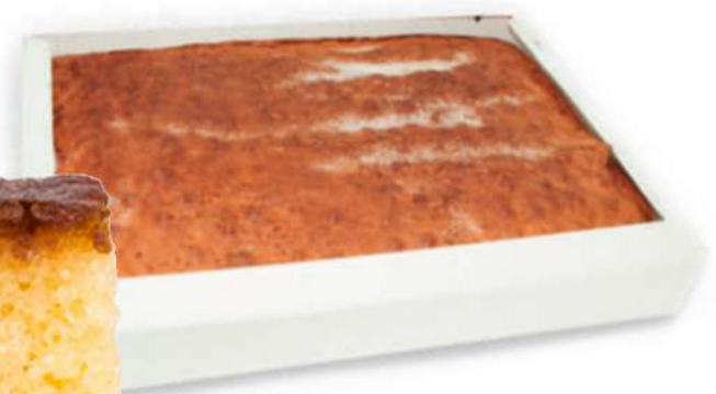
Torta Casera Limón 2000 gr.