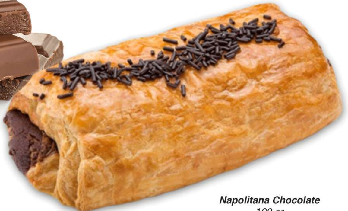
Napolitana Chocolate 100 gr Caja de 20 Unidades