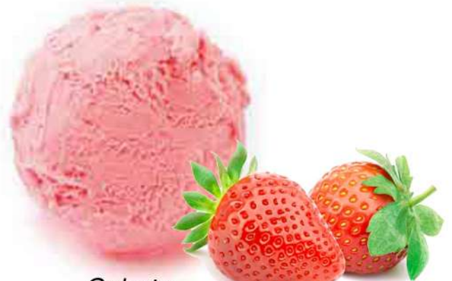
Cubeta 2500 MI.