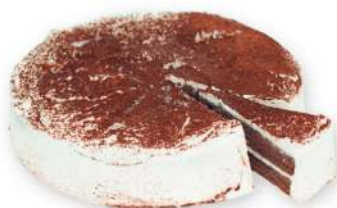
Tarta Tiramisú 750 gr.