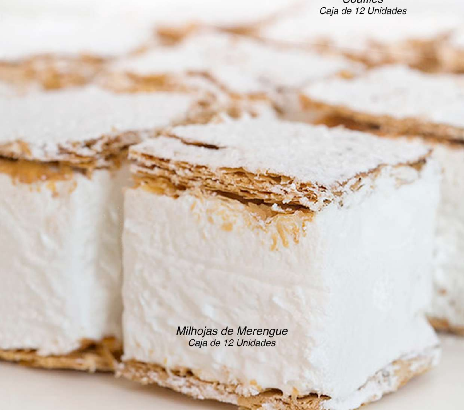
Milhojas de Merengue Caja de 12 Unidades