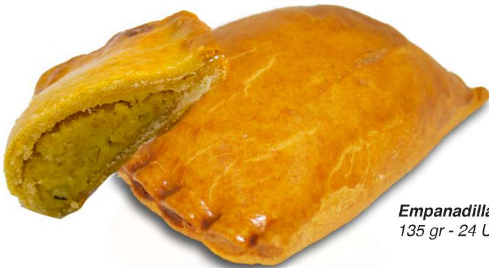
Empanadilla Patata 135 gr - 24 Uni Caja