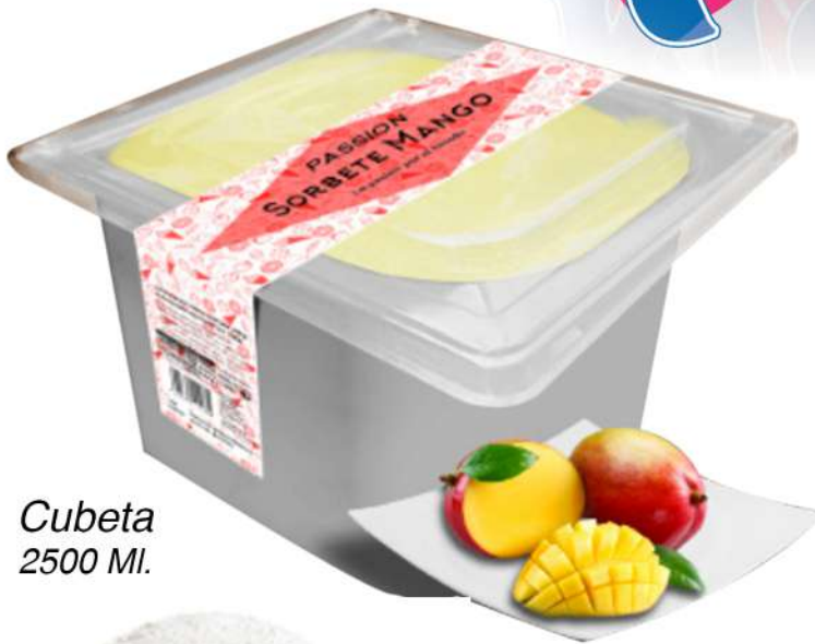
Cubeta 2500 MI.