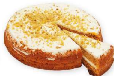
Tarta Carrot Cake 750 gr.