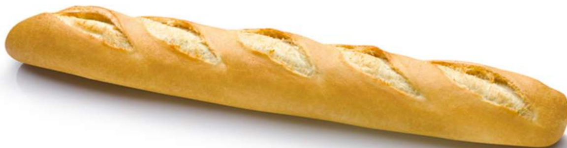
Barra 260 COMÚN Caja 25 Unidades. 260 gr. Aprox.