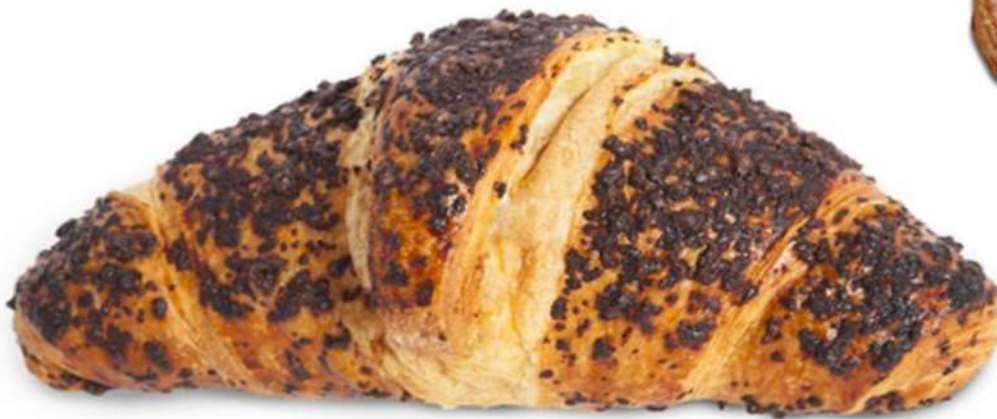
Croissant Parisino Choco Rapid Fermentado Caja 48 Unidades. 90 gr. Aprox. (Totalmente decorado, tal cual)