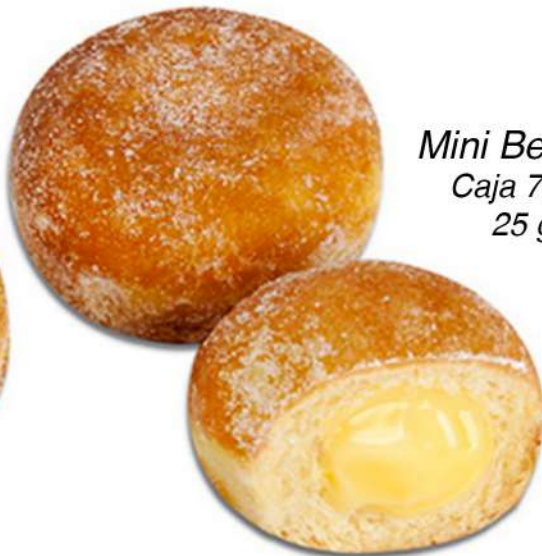
Mini Berlina Crema Caja 70 Unidades. 25 gr. Aprox.