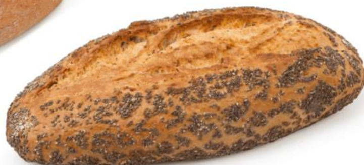
Hogaza de CHÍA Caja 13 Unidades. 400 gr. Aprox.