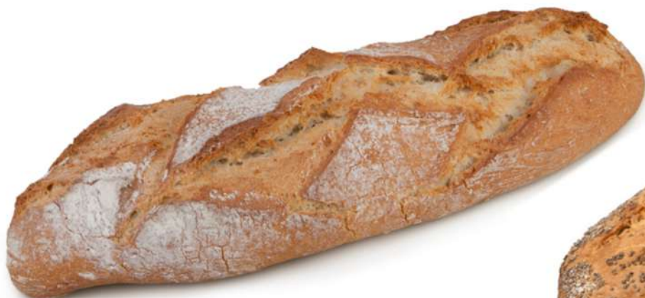
Hogaza SARRACENO Caja 13 Unidades. 550 gr. Aprox.