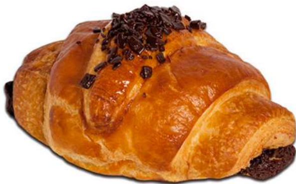
Caracola Crema Cacao Rapid Fermentado Caja 168 Unidades. 55 gr. Aprox.