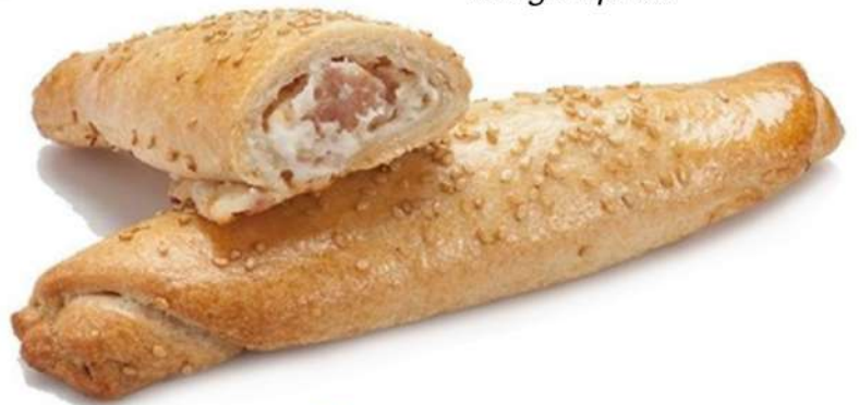
Rollito Bacon-Queso Caja 40 Unidades. 100 gr. Aprox.