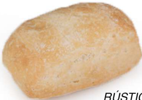
Montadito RÚSTICA CRISTAL Express Caja 125 Unidades. 45 gr. Aprox.