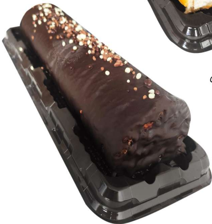
Brazo Trufa Caja de 3 Unidades