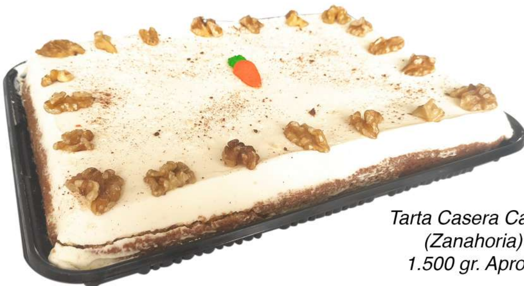
Tarta Casera Carrot (Zanahoria) 1.500 gr. Aprox.