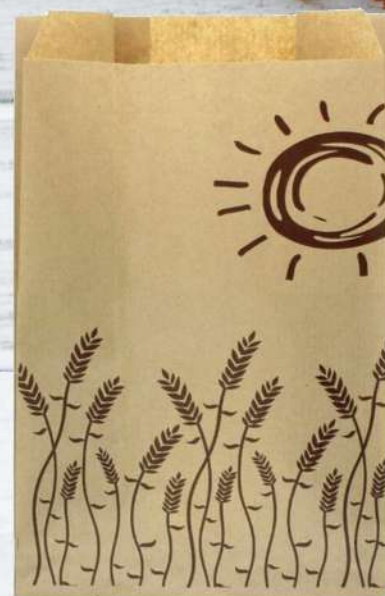
Bolsa de Bollería 14x6x25 cm. Caja de 1000 Unidades