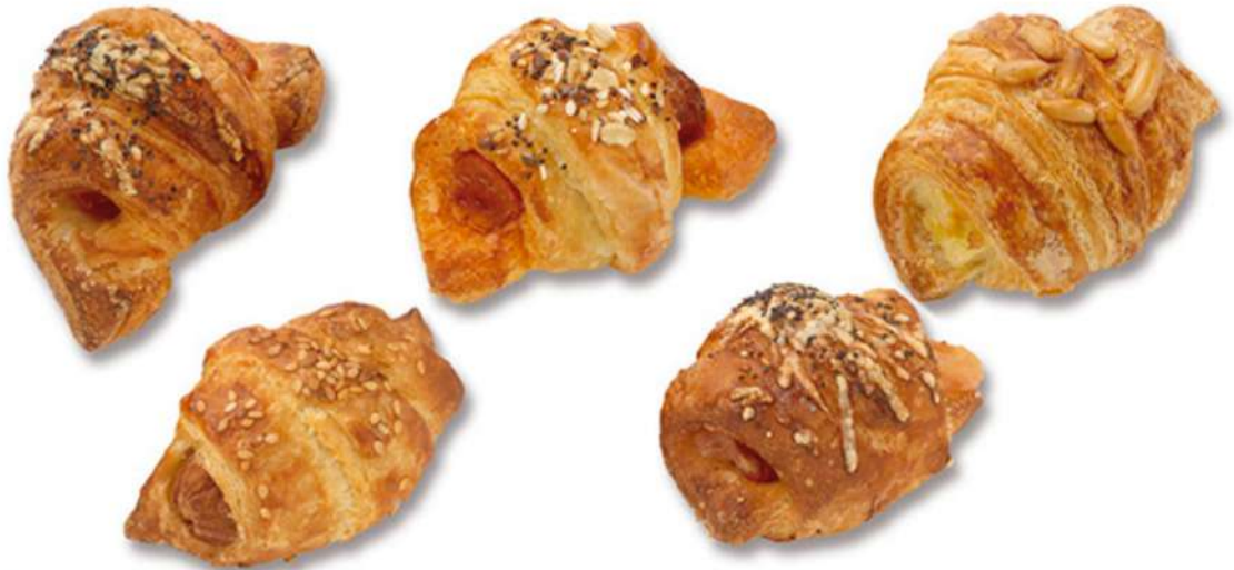
Saladitos Surtidos Croissant Caja 133 Unidades. 30 gr. Aprox. (4 Kg)