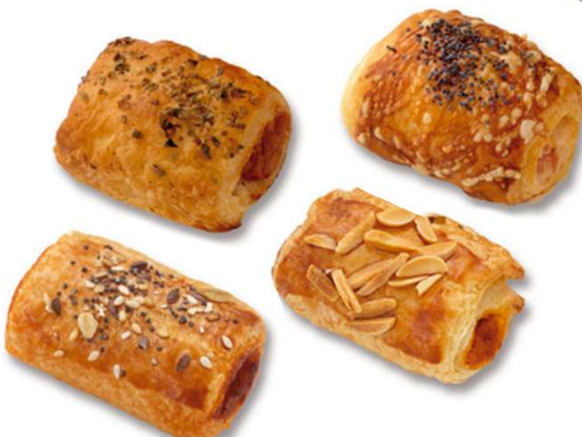
Saladitos Mini Chic Surtidos Caja 556 Unidades. 20 gr. Aprox. (10 Kg)