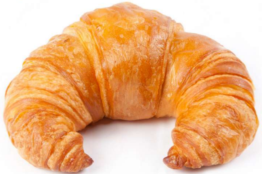
Croissant Mantequilla Curvo Terminado 70 gr Caja de 22 Unidades