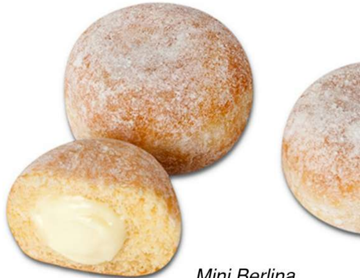
Mini Berlina Chocolate Blanco Caja 70 Unidades. 25 gr. Aprox.