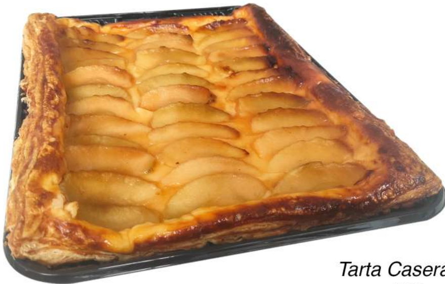
Tarta Casera de Manzana 750 gr. Aprox.