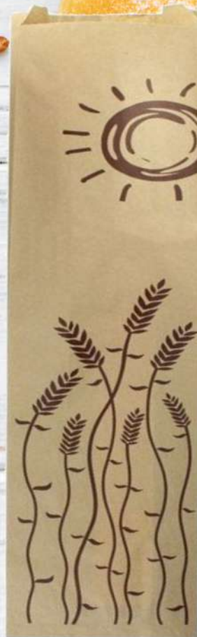
Bolsa de Pan 2 Barras 12x6x51 cm. Caja de 1000 Unidades