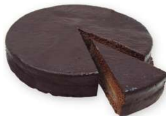
Tarta Sacher 750 gr.