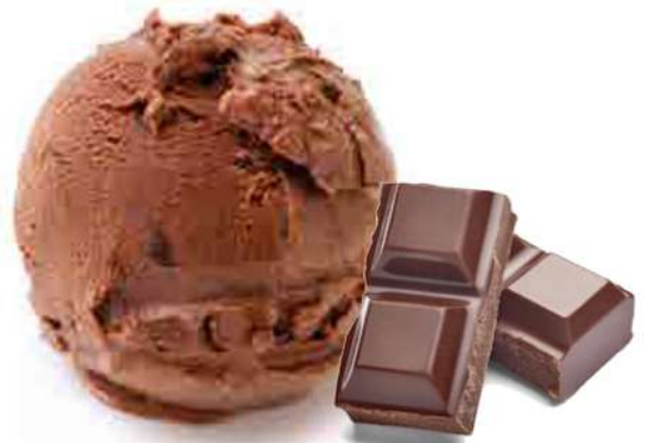
Cubeta 2500 MI.