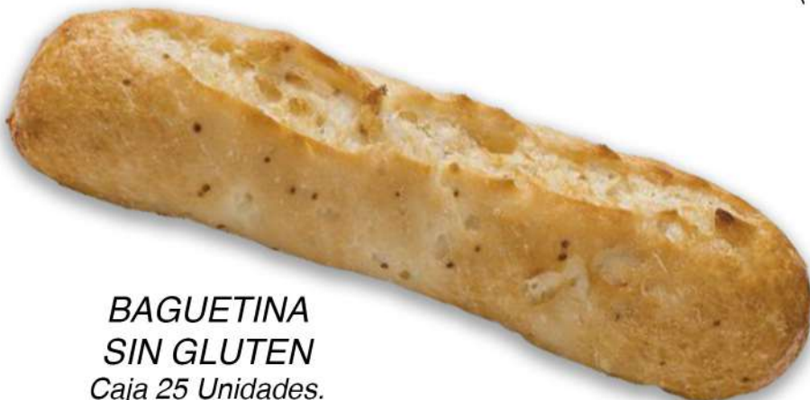
BAGUETINA SIN GLUTEN Caja 25 Unidades. 105 gr. Aprox.