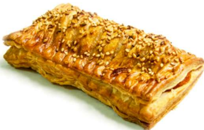
Hojaldre Napoli Caja 24 Unidades. 140 gr. Aprox.