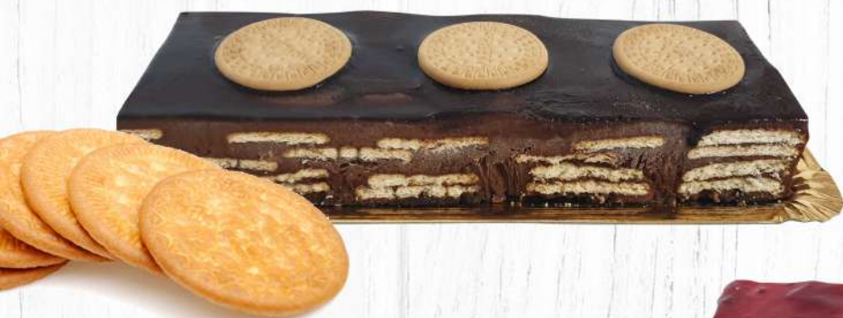
Banda Porción de la Abuela Bandeja de 425 gr.