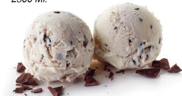
Cubeta 2500 MI.