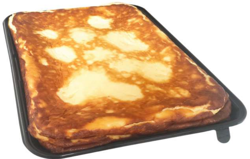
Tarta Casera de Queso 2.300 gr. Aprox