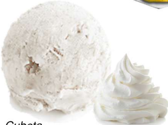
Cubeta 2500 MI.