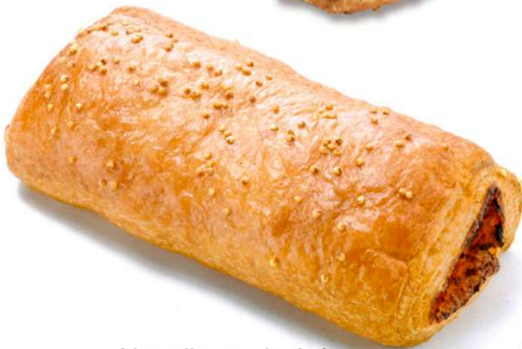
Napolitana de Atún Caja 60 Unidades.